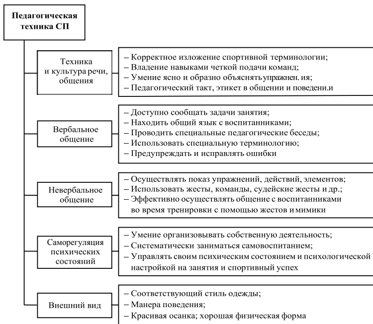
Рис. 1. Элементы и сущность педагогической техники спортивного педагога

Педагогическая техника — умение управлять собой, умение взаимодействовать. Владение умениями педагогической техники позволяет спортивному педагогу в полной мере осуществлять свои функции. Рассмотрим подробнее те из них, осуществление которых требует от педагога владения умениями педагогической техники.